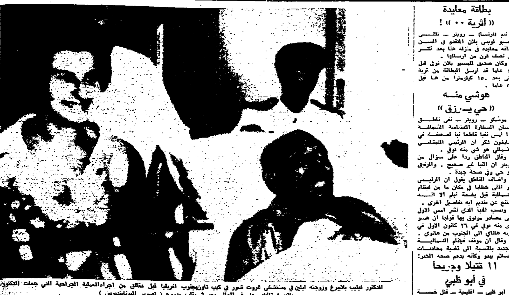
الكتور فليب باليرغ وزوجته ايلين في مستشفى فروت شور في كيب تاون جنوب افريقيا قبل دقائق من اجراء العملية الجراحية التي جعلت الككتور يخرج ثلاث رجل في العالم يعيشون بزوجة